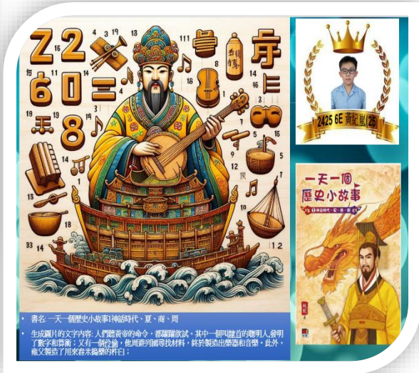
書名: 一天一個歷史小故事 生成圖片的文字內容: 人類需要帝王的命令, 都聽命改政。其中一個叫達芬奇的聰明人, 發明了數字和指南針; 又有一個位爺, 他周遊列國尋找材料, 終於製出樂器和音樂。此外, 他文能居了用來容未編樂的杆白。