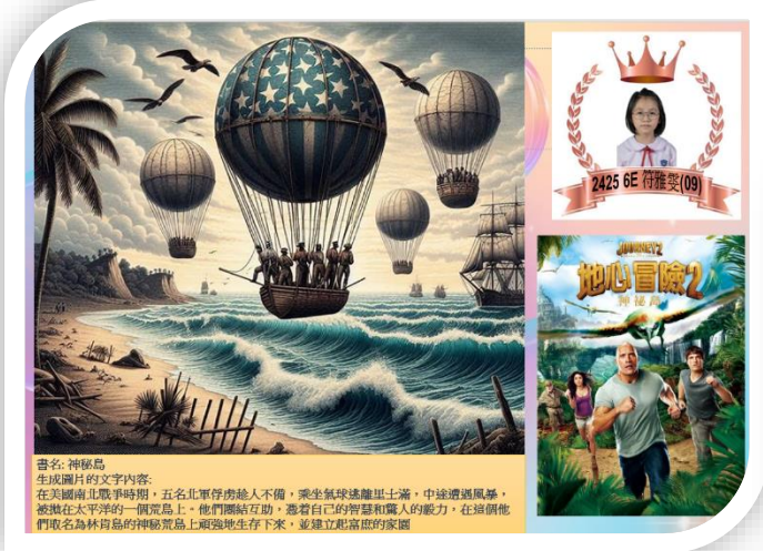
書名: 神秘島 生成圖片的文字內容: 在美國南北戰爭時期, 五名北軍俘虜趁人不備, 乘坐氣球遠離軍士營, 中線避過風暴, 被飄在太平洋的一個荒島上。他們團結互助, 憑著自己的智慧和驚人的毅力, 在39個他們取名為林肯島的神祕荒島上頑強地生存下來, 並建立起富庶的家園。