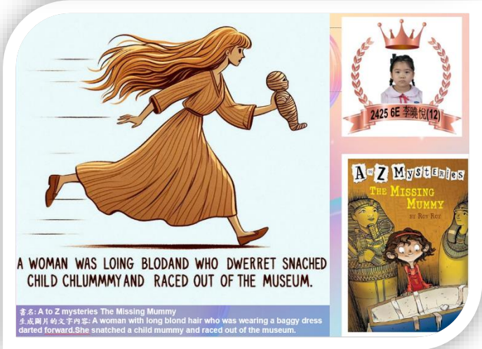
A WOMAN WAS LONG BLODAND WHO DWERRET SNACHED CHILD CHLUMMYAND RACED OUT OF THE MUSEUM. 書名: A to Z mysteries The Missing Mummy 生成圖片的文字內容: A woman with long blond hair who was wearing a baggy dress darted forward. She snatched a child mummy and raced out of the museum.